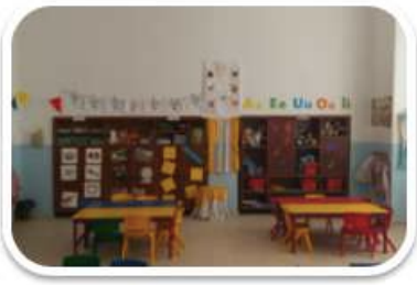
Aula 3 años