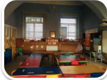
Aula 4 años