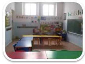
Aula 5 años